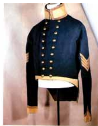
Disegno di Don Troiani – Military Illustrated.